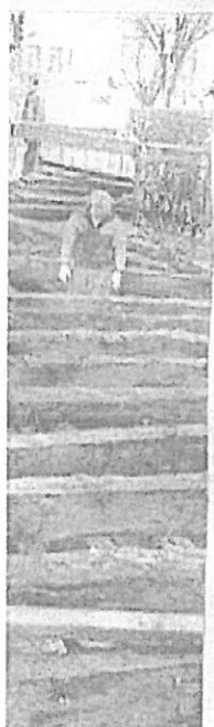
brana na czas re-

Jeśli wszystko pójdzie zgodnie z planem, jesienią 2008 r. Czas trwania budowy to ok. półtora roku.